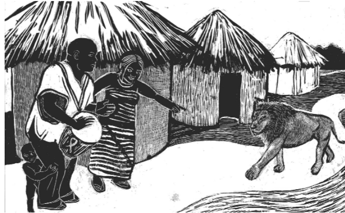
Yeroo leenci ganda kee keessa dhufu, sagalee bilbila kee tii olkaasuu qabda